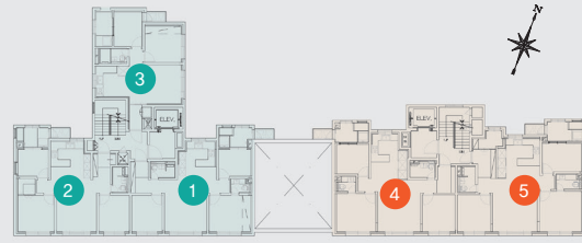
[신목동 비바힐스 평면도]