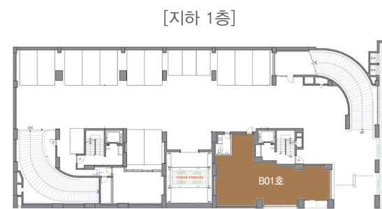
권장업종 B1 슈퍼, 맥주전문점, 마트, 전문음식점, 잡화